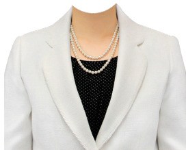
フォーマル② (ネックレス付)

各種着せ替えデータは正面以外の角度データもご準備しています。 合成の際はお写真のお顔の向きに合わせ、 自然な角度のデータを選んで使用させていただきます。