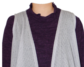
メローネック +ニットベスト