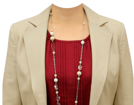
ジャケット+ブラウス (ネックレス付)