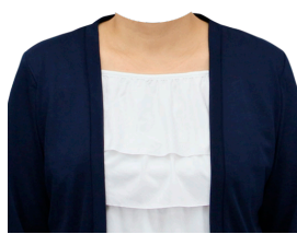
フリルカットソー +カーディガン