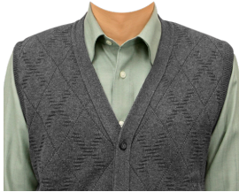
ニットベスト (グリーンシャツ)