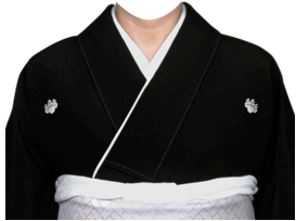
白帯着物 ※家紋付・変更可能