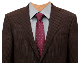
スーツ⑨ (茶ストライプ+グレーシャツ)