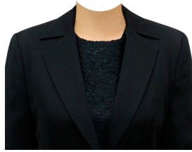
黒洋服テーラード