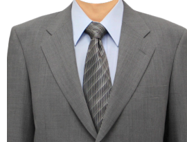
スーツ④ (グレー+ブルーシャツ)