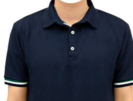
ポロシャツ (半袖ネイビー)