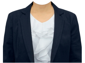
ジャケット +フリルブラウス