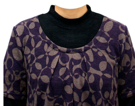
タートルネック カットソー