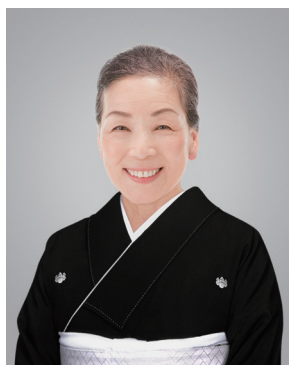
切り抜きA (帯が見える程度)