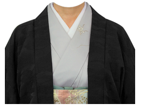
和服⑲ (薄グレー訪問着+黒羽織)