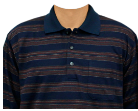
ポロシャツ (紺ボーダー)