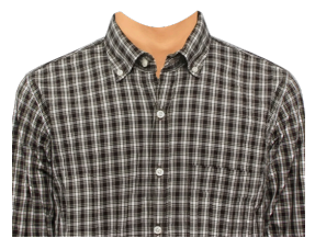
チェックシャツ (ブラウン系)