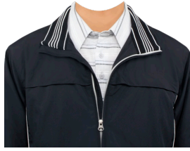
ブルゾン (ネイビー系)