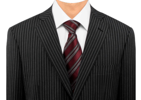
スーツ⑯ (ストライプ+白シャツ)