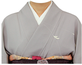
和服⑮ (薄墨色訪問着)