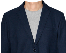
カジュアルジャケット (グレーTシャツ)