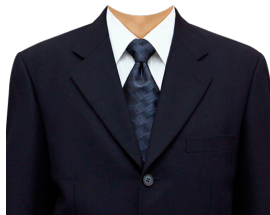
スーツ⑭ (濃紺スーツ+白シャツ)