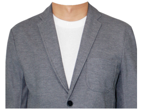
カジュアルジャケット (白Tシャツ)