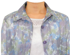
柄ブラウス+インナー