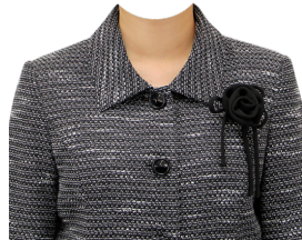
フォーマル⑨ (コサージュ付)