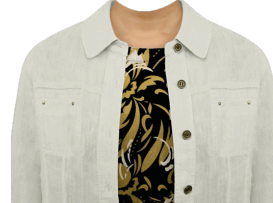
アンサンブル (柄インナー)