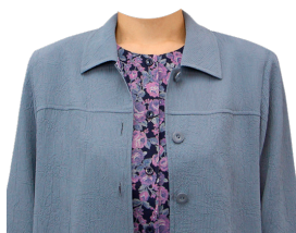
花柄アンサンブル