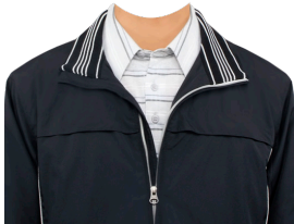
ブルゾン (ネイビー系)