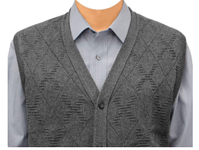
ニットベスト (グレーシャツ)