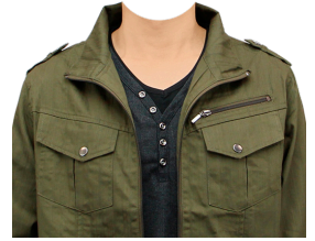
カーキジャケット