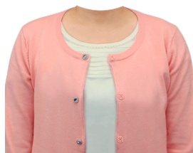
ニットアンサンブル (ピンク系)