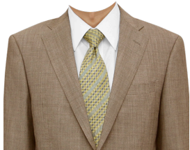
スーツ⑪ (ベージュスーツ+白シャツ)