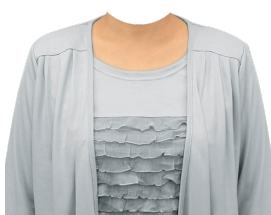
アンサンブル (フリルブラウス)