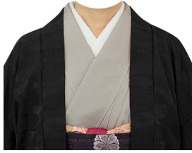
和服⑯ (薄墨色訪問着+黒羽織)