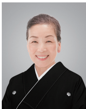
切り抜きB (帯が見えない程度)