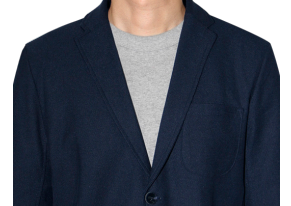
カジュアルジャケット (グレーTシャツ)

掲載の着せ替えから色味変更も可能な場合もございます。詳しくはオペレーターまでご相談ください。