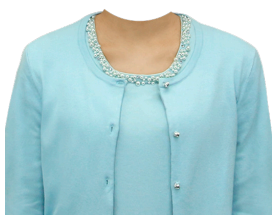
ニットアンサンブル (ブルー系)