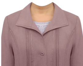
無地ブラウス (デザインインナー)