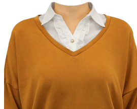
レイヤード風 プルオーバー