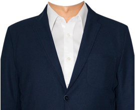
カジュアルジャケット (白シャツ)