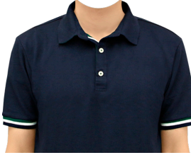
ポロシャツ (半袖ネイビー)