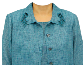
デザインジャケット