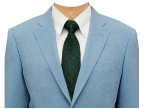
スーツ⑩ (薄青スーツ+白シャツ)