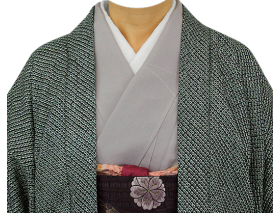
和服⑰ (薄墨色訪問着+絞羽織)