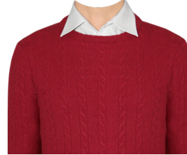
丸襟ニット (白シャツ)