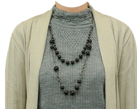
メローネック+カーディガン (ネックレス付)