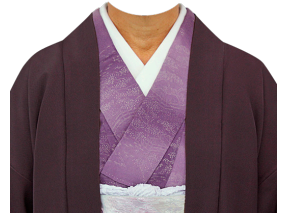
和服㉔ (紫小紋+紫羽織)