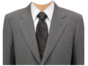
スーツ⑤ (グレー+白シャツ)