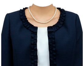
フォーマル⑦ (ネックレス付)