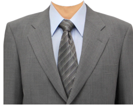
スーツ④ (グレー+ブルーシャツ)