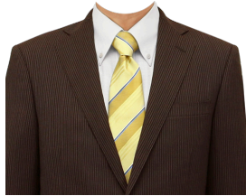
スーツ⑧ (茶ストライプ+白シャツ)