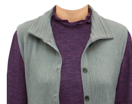
メローネック +ニットベスト