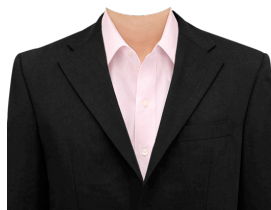
ジャケット⑦ (ブラック)