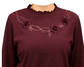
メローネック カットソー