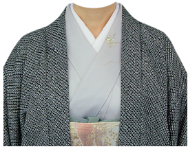
和服⑳ (薄グレー訪問着+絞羽織)