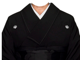
黒帯着物 ※家紋付・変更可能