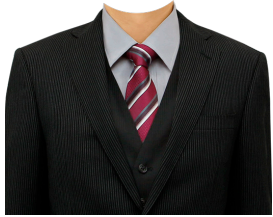
スーツ⑥ (縞スーツベスト付)