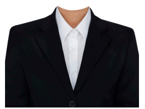
黒テーラードスーツ (白ブラウス)