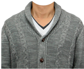
カーディガン (グレー)