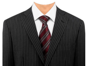
スーツ⑮ (ストライプ+白シャツ)