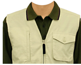
ポロシャツ+ベスト