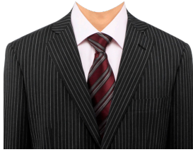
スーツ① (ストライプ+ピンクシャツ)