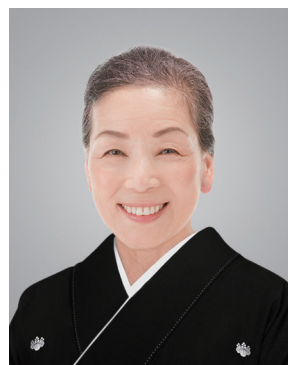
切り抜きC (家紋ギリギリ)