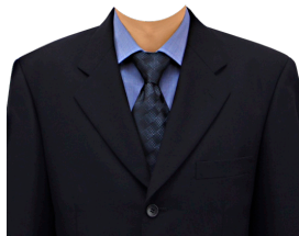
スーツ⑬ (濃紺スーツ+ブルーシャツ)