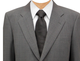
スーツ⑤ (グレー+白シャツ)