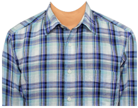
チェックシャツ (ブルー系)