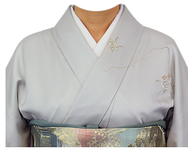
和服⑱ (薄グレー訪問着)