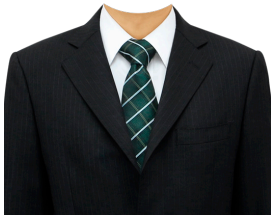
スーツ⑦ (縞スーツ+白シャツ)