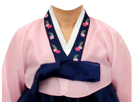
チョゴリ ピンク×紺