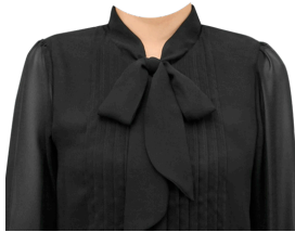
ボウタイブラウス (ブラック)