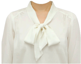
ボウタイブラウス (ホワイト)