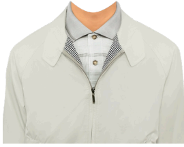
ブルゾン (ライトグレー系)