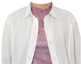
メローネック+シャツ