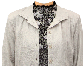
メローネック +シワ加工ジャケット