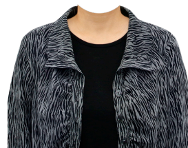
ゼブラ柄アンサンブル