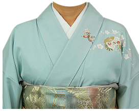
和服㉑ (水色付け下げ)