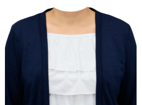
フリルカットソー +カーディガン