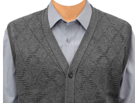
ニットベスト (グレーシャツ)