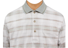
ポロシャツ (グレー系柄)