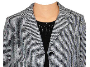
ストライプジャケット