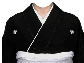
白帯着物 ※家紋付・変更可能