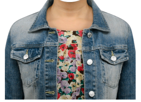
デニムジャケット