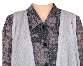
花柄ブラウス +ニットベスト