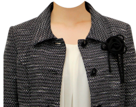
フォーマル⑧ (コサージュ付)