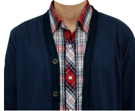
カーディガン (ネイビー)