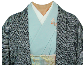
和服㉒ (水色付け下げ+絞羽織)