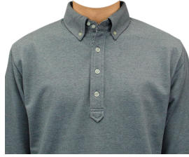
ポロシャツ (長袖グレー)