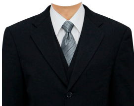
スーツ⑫ (ブラックベスト付)