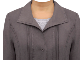
無地ブラウス (デザインインナー)